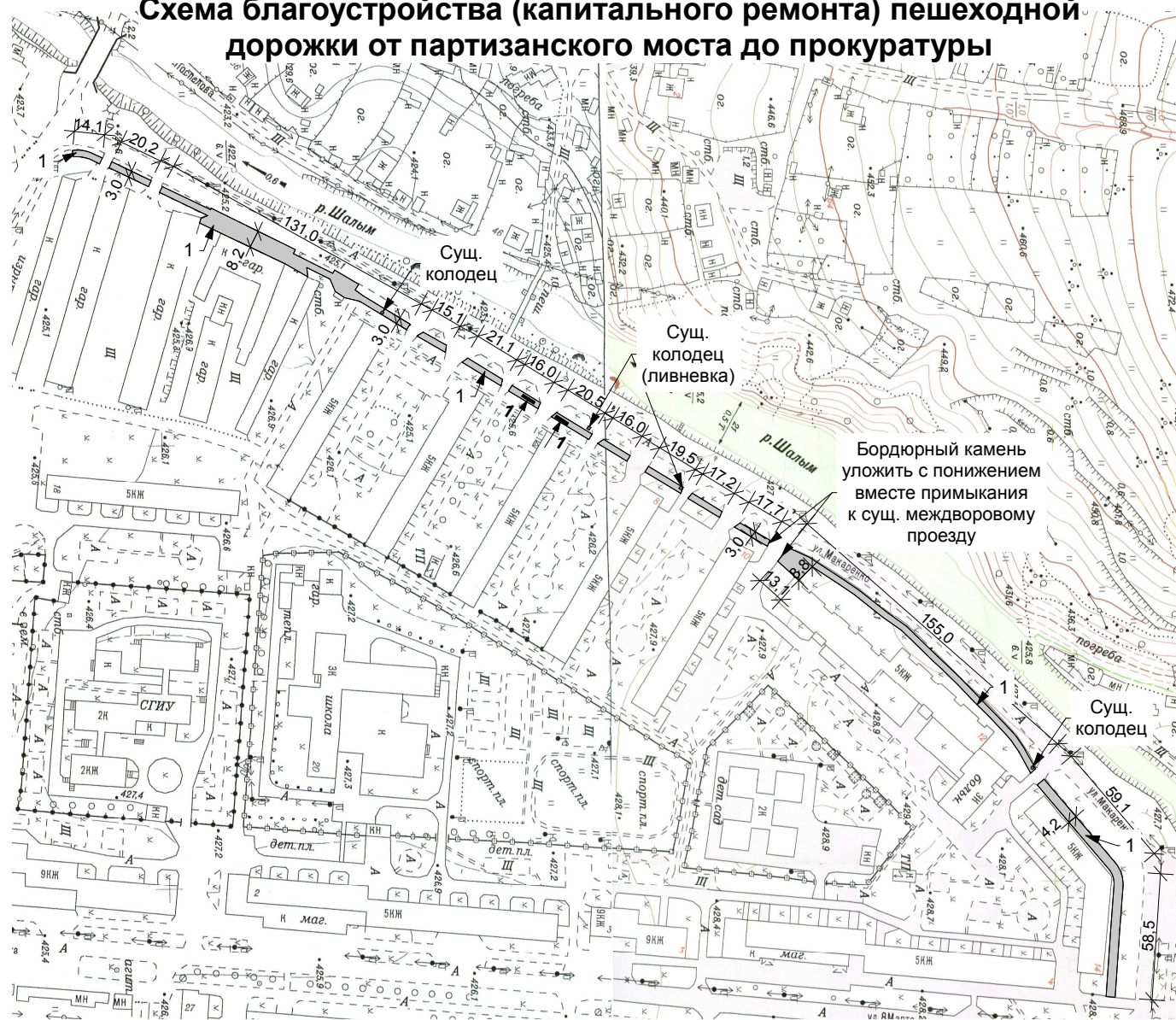
Схема благоустройства (капитального ремонта) пешеходной дорожки от партизанского моста до прокуратуры